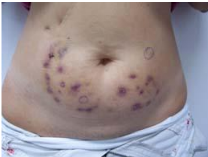
Fig. 3: Caso de micobacteriosis postmesoterapia. Fue aislada Mycobacterium fortuitum .