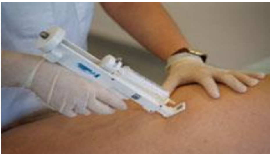
Fig. 2. Técnica asistida.

La otra técnica, la, asistida , utiliza pistolas (mecánica, neumática o eléctrica) que favorecen un pinchazo rápido, breve, preciso y prácticamente, indoloro. La pistola permite calibrar la profundidad del pinchazo, la dosis del medicamento administrado por unidad puntural y la frecuencia de las ráfagas.