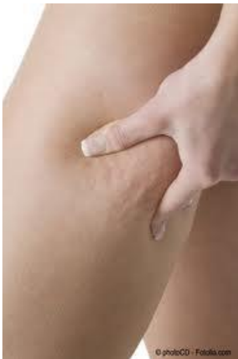
Fig. 5: Aspecto de la celulitis.