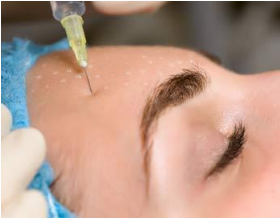
Fig. 1. Técnica manual. Método nappage

La técnica puede ser manual (mano-jeringa-aguja) cuyo inconveniente es el dolor que generan los pinchazos y la no uniformidad de la dosis. Este hecho genera discomfort en algunos pacientes. Sin duda, las inyecciones producen rotura de la piel, es decir, dolor que se puede desglosar en dos tiempos: primer momento rotura de tejidos y segundo momento dolor secundario por la introducción de sustancias con distinto pH al de la dermis o volúmenes importantes. Una buena técnica inyectiva, un gesto rápido y decidido minimiza la sensación dolorosa.